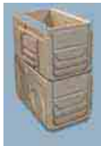
AF300S + A300B

* Possibilité d'augmenter la hauteur de l'avaloir en incorporant un élément intermédiaire * The Sump unit can be higher incorporating an intermediate unit.